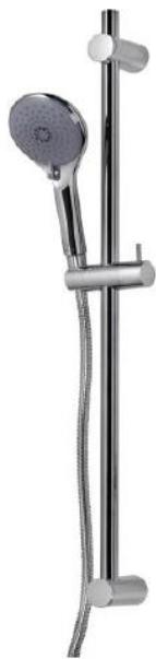
Immagine Prodotto - Product Image

Штанга настенная 75 см Ø20 мм с креплением регулируемым по высоте, Ручная лейка SYNCRONIA/2, Шланг латунный дв.фальцевания 150 см